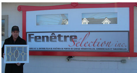
Sylvio Laquerre, propriétaire de Fenêtres Sélection

Nous aimerions connaître votre intérêt à la possibilité de vous regrouper au Centre des Loisirs sous le toit de la patinoire pour la journée du samedi 25 mai de 9h00 à 17h00 . Communiquez avec nous au 418 744-3222 .