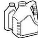
Contenants fermés d'huile à moteur et végétale