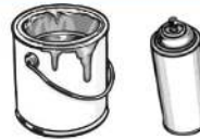
Peinture et teinture résidentielle, vernis, laque, aérosol, solvant