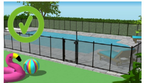
Bien qu'amovible, cette clôture est solidement ancrée au sol.