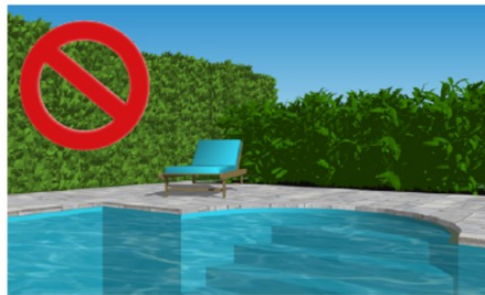
Une haie ne constitue pas une enceinte.