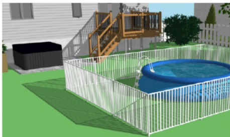
Exemple de piscine démontable ou gonflable de moins de 1,4 m de hauteur devant être entourée d'une enceinte.

Merci pour votre compréhension et votre collaboration!