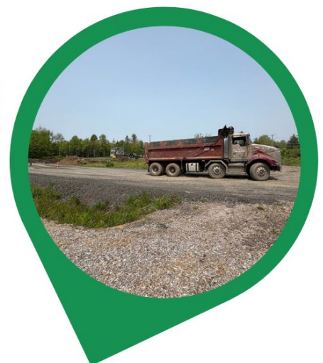
Début des travaux civils à l'Espace citoyen