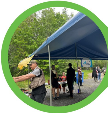
Fête de la pêche