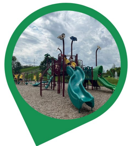
Sorties et activités au terrain de jeux