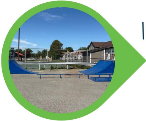
Installation des modules de skateparc