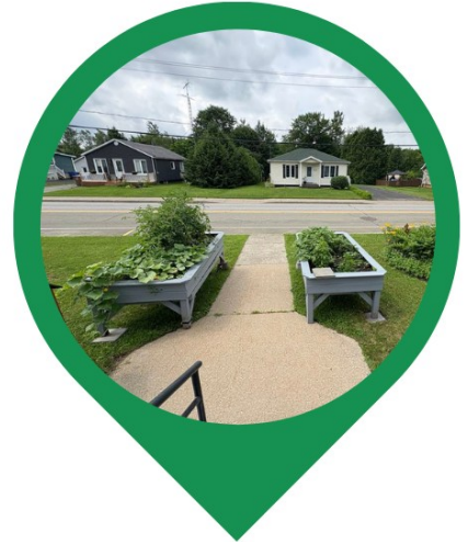
Installation des bacs de légumes