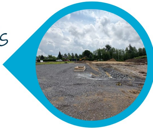
Travaux civils à l'Espace citoyen