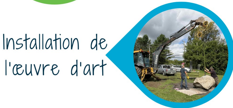
Installation de l'œuvre d'art