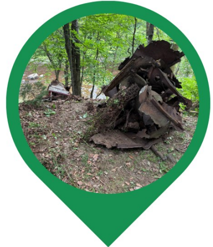
Retrait de carcasses de voiture avec l'OBV du Chêne