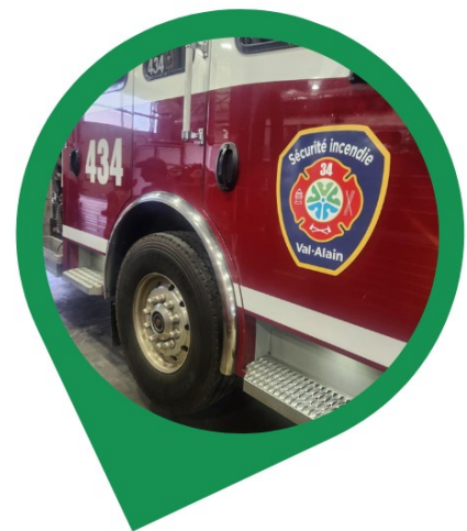
Préparation du nouveau camion de pompiers