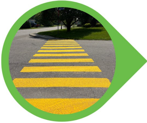
Lignage de traverses piéton