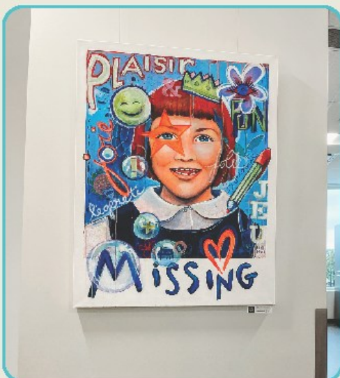
Œuvres d'Irène Lumineau